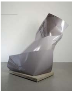
Foto: Herbert Hofer: „corner of room“, 2016/2017, Tintenstrahl Druck auf 3-D Folie auf Aluminium, ca. 180 × 156 × 110 cm

DOWNLOAD in Druckqualität: http://sehsaal.at/wp-content/uploads/2017/08/sehsaal_HerbertHofer_person_room.jpg