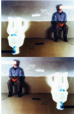
Foto: Herbert Hofer: „person in a room“, 2012/2017, analoger C-Print, Auflage 3, 100 × 65 cm

Foto/Credit: Herbert Hofer, Abdruck honorarfrei bei Namensnennung!