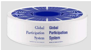
BOX QUATTORDICI 2017

Abdruck honorarfrei bei Namensnennung!