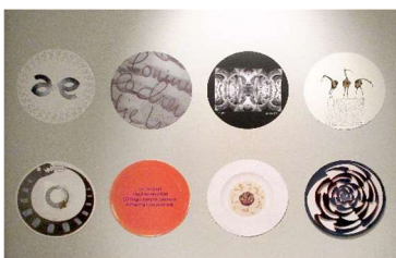
Ausstellungsansicht Viareggio Juli 2017

http://sehsaal.at/wp-content/uploads/2017/10/17bau14viareggiocbau.jpg