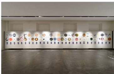
Ausstellungsansicht Viareggio Juli 2017

http://sehsaal.at/wp-content/uploads/2017/10/bau-14_box2.jpg