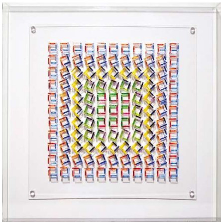
Françoise Aubry, Ohne Titel, 2017, PMMA und Acrylmalerei, 50x50 cm

Foto: Milija Belić; Abdruck honorarfrei bei Namensnennung