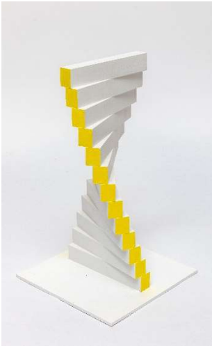
MILIJA BELIC, Glissandi jaune, 2016, Holz bemalt, 44 x 20 x 20 cm