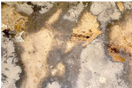
Details Bodenansicht sehsaal

Die Hamburger Künstler:innen Sylvia Schultes und Hinrich Gross konzipieren für den sehsaal eine ortsbezogene Videoinstallation. Grundlage ist der Boden des sehsaals mit seiner malerischen Farbigkeit und camouflagearartigen Anmutung. In einer Verschränkung ähnlicher Strukturen verschiedener Maßstäbe erklingt auf den drei geschlossenen Wandflächen des Raumes ein optischer Widerhall des Bodens, auf dem die Betrachter*innen stehen.